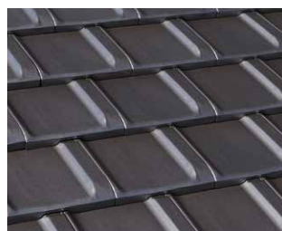
グレイ F.GRAY マンセル値 0.5P 5.4/0.4