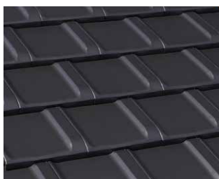
ブラック F.BLACK マンセル値 3.6RP 3.5/0.1 (N3.5)