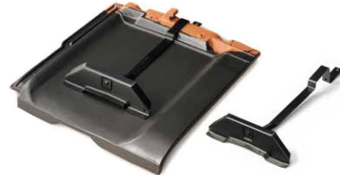
雪止金具 対応色：ブラック