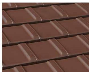
ブラウン F.BROWN マンセル値 7.2YR 3.4/1.3