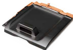
雪止瓦 対応色：瓦全色