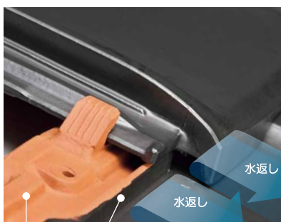
防水壁 (2段目) 防水壁 (1段目)