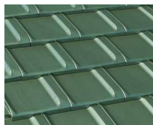
グリーン F.GREEN マンセル値 3.7G 4.8/1.5